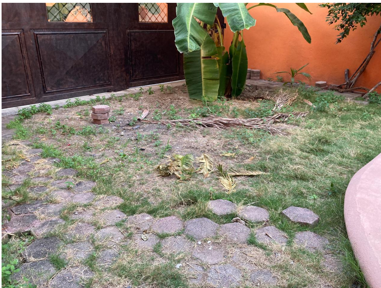
Espacio 1: Planta baja.

Anexos 1, espacios para el recuento total o parcial de votos en el inmueble que ocupa el CDE12: